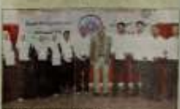
विद्यार्थियों को लक्ष्मी देवता की पूजा कराने से पहले...